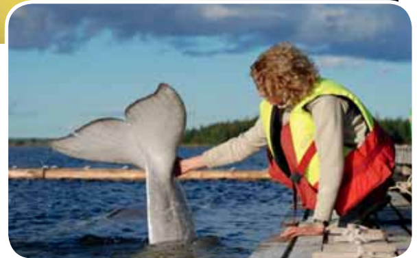
Na Semjonově ocasu jsou dodnes patrné jizvy způsobené lvounem, který jej před léty poranil.

Běluha - někdy také nazývaná bílá velryba - je na vzduchu stej-