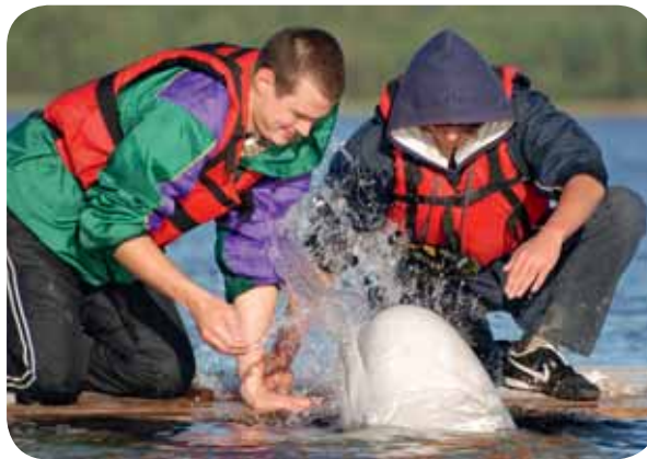
...a na přivítanou vás pokropí přesně mířenou dávkou.