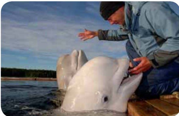
Ke komunikaci s běluhami používá jejich ošetřovatel ultrazvukovou pišťalku a signály rukama.

např. u netopýrů. Slyší-li člověk zvuk nejvýše o 20 kHz, pak běluha slyší ultrazvuk o 200 kHz. Jako akustické zrcadlo slouží běluhám zvláštní útvar na čele tzv. meloun. Běluha dovede vydávat zvuky, které se skládají ze cvakání (12- 15 kHz), hvízdání (3,45- 9 kHz), trylkování (4 kHz), troubení (13 kHz), klapání čelistmi a zpě-